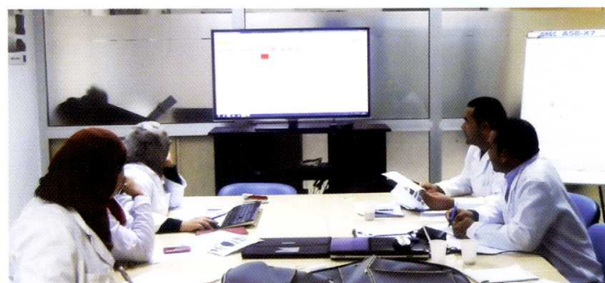
Des actions de formation sur mesure et à la carte en intra entreprise pour améliorer votre compétitivité industrielle.