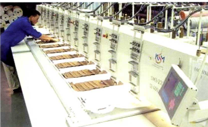
Accompagnement technique pour l'extension ou la création de nouveaux projets