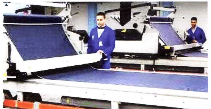
Des assistances techniques pointues dans les différentes activités: filature, tissage, finissage, confection, etc...

« Le CETTEX, votre Centre d'appui pour la compétitivité »