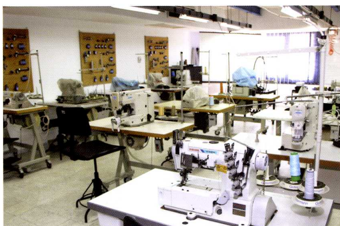
Des salles dédiées aux formations et perfectionnements en inter (coupe, mécanique, piquage, modélisme, CAO....)