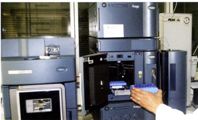
Des équipements performants pour la détection des substances allergènes, cancérigènes et des métaux lourds.