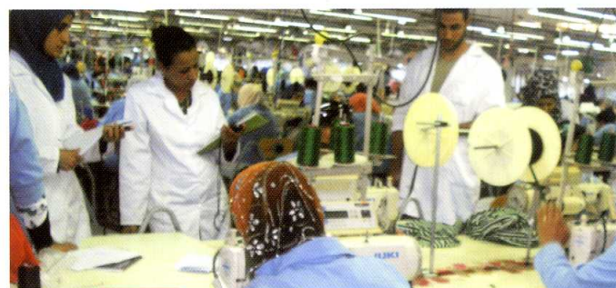
Un accompagnement personnalisé selon vos besoins de développement et de perfectionnement des compétences.

« Plus de 25 ans d'enseignement et de savoir faire dans l'industrie Textile et Habillement »